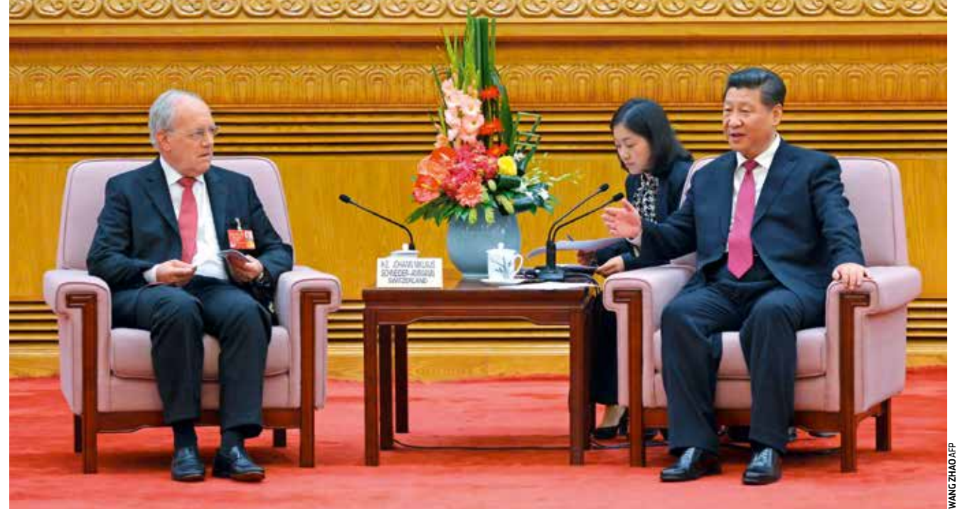
PÉKIN Le ministre de l'Économie Johann Schneider-Ammann a signé la participation de la Suisse à la Banque asiatique d'investissement en juin dernier, en présence du président chinois Xi Jinping.

Ce projet lancé à marche forcée place aujourd'hui le Conseil fédéral dans une situation délicate. La Suisse s'est engagée